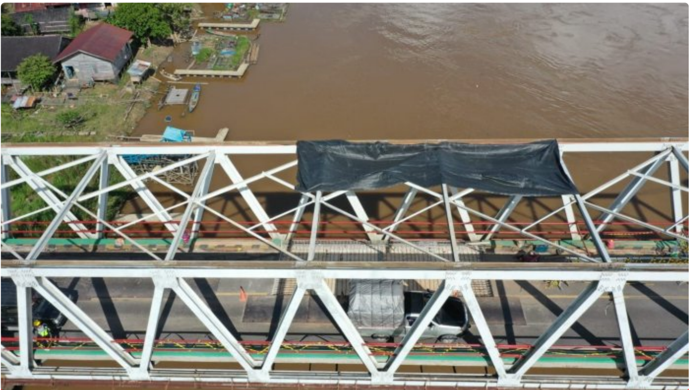
Jembatan Kasongan (Sei Katingan) Dalam Proses Perbaikan Oleh BPJN Kalimantan Tengah

KATINGAN - Penutupan jembatan Sei Katingan atau jembatan Kasongan, Kabupaten Katingan yang direncanakan akan ditutup pada tanggal 27 Maret 2023, akan diundur dua hari yaitu pada tanggal 29 Maret 2023.